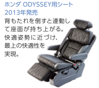
ホンダ ODYSSEY用シート 2013年発売 背もたれを倒すと連動して座面が持ち上がる。快適姿勢に近づけ、最上の快適性を実現。