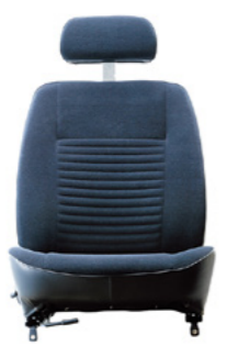
ホンダ 初代CIVIC用シート 1972年発売

当グループにとって四輪車用シートづくりの原点ともいえる、ホンダ初代CIVIC用シート。表皮の縫い目破れや、当時は日本人のみを想定して設計したことで、極端に大きな体格の方が乗るとシートフレームが変形するなどトラブルが頻発しました。こうした、トラブルを即座に社内共有し迅速に改善するシステムは、現在でも活かされており、当時の苦い経験が品質への強いこだわりへと受け継がれています。