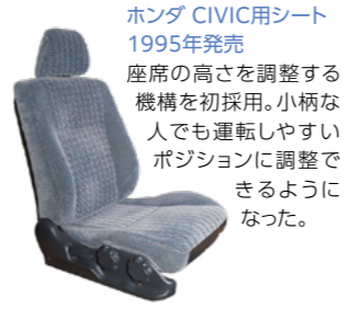
ホンダ CIVIC用シート 1995年発売 座席の高さを調整する機構を初採用。小柄な人でも運転しやすいポジションに調整できるようになった。

人によって感じ方の異なる快適さや疲労度等の官能性能を定量化し、人間工学に基づいた研究を重ね、快適姿勢の独自理論を製品に反映するなど「快適で疲れにくい」シートを追求し続けています。