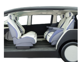
ファミリーコンフォートキャビン シーンに合わせてシート間の協調制御により自在なシートアレンジを実現。多彩な機能を搭載し、広さを活かしたミニバンならではの空間を提案。

自動車業界は大変革期を迎え、自動車に求められる価値が刻々と変化しています。こうした状況の中、当グループはシートやドアにとどまらず、車室内空間全体をコーディネート可能な「内装システムサプライヤー」を目指し、新たな価値創造に挑戦しています。その成果の一部をお披露目する「次世代車室内空間発表会」を定期開催しており、本誌では、2024年に開催した際の、展示品をご紹介します。▶ P.26-P.29